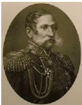
Микола Миколайович Анненков – «генерал отъ инф., членъ Госуд. Совѣта», ≈1850 рік

У своїх мемуарних записках Віра Бухаріна розповідала про те, як вона, сімнадцятирічна, закінчивши Смольний інститут, навесні 1830 року переїхала з батьком до Москви і стала часто бувати у «вищому» світі. На чудовому балі у князя Сергія Голіцина «... танцювала з поетом Пушкіним», який був їй знайомий, адже в 1820 - 1821 роках той відвідував будинок її батька в Києві, в Москві і Петербурзі і був вхожим у їхній дім. Залишила вона спогади і про Михайла Лермонтова, про те, що нею захоплювався Тургенєв.